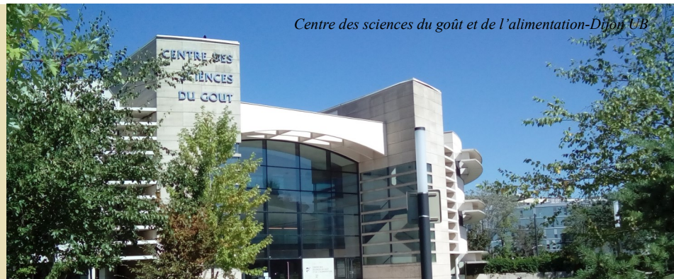
Centre des sciences du goût et de l'alimentation-Dijon UB