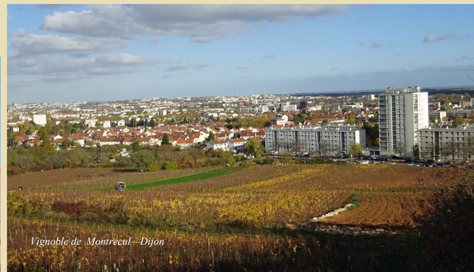
Vignoble de Montrecul—Dijon