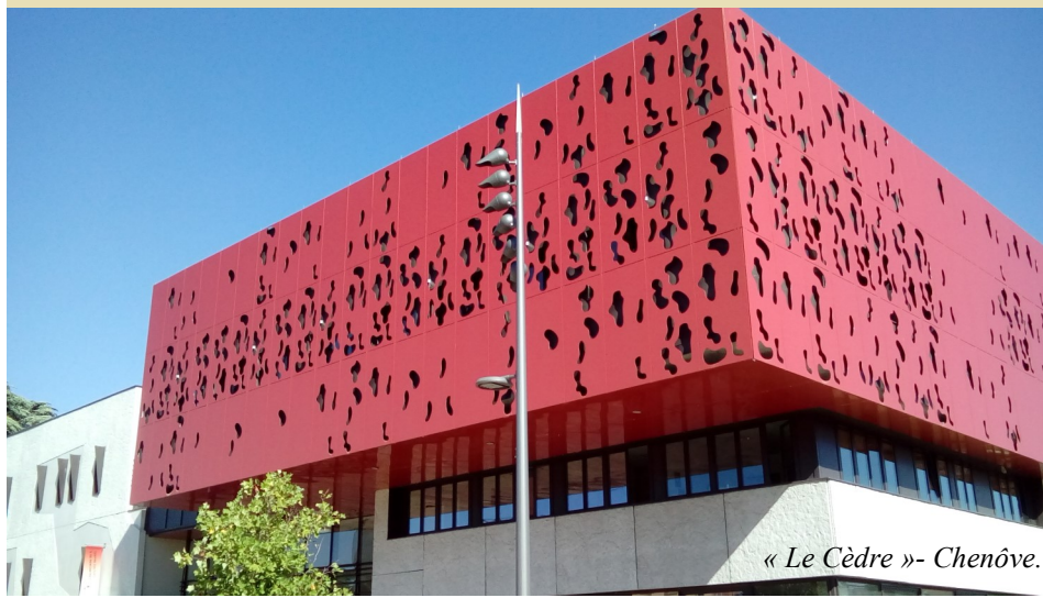
« Le Cèdre »- Chenôve.