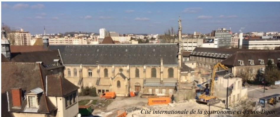
Cité internationale de la gastronomie et du vin-Dijon